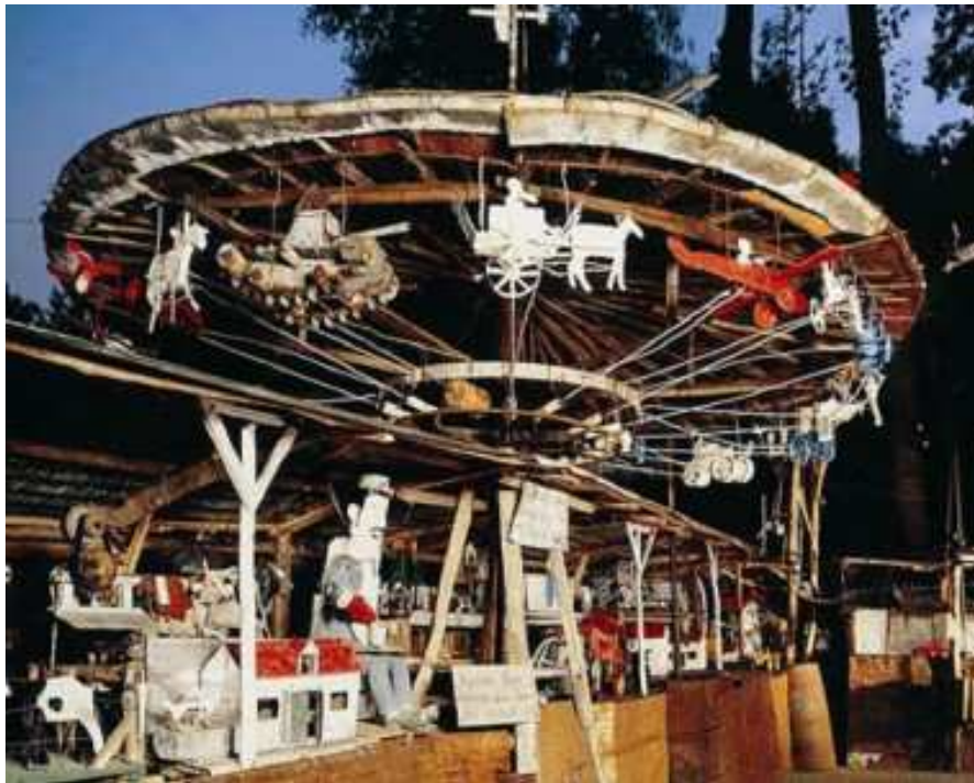
Le Manège réel von Pierre Avezard exposé à la Fabuloserie à Dicy en France